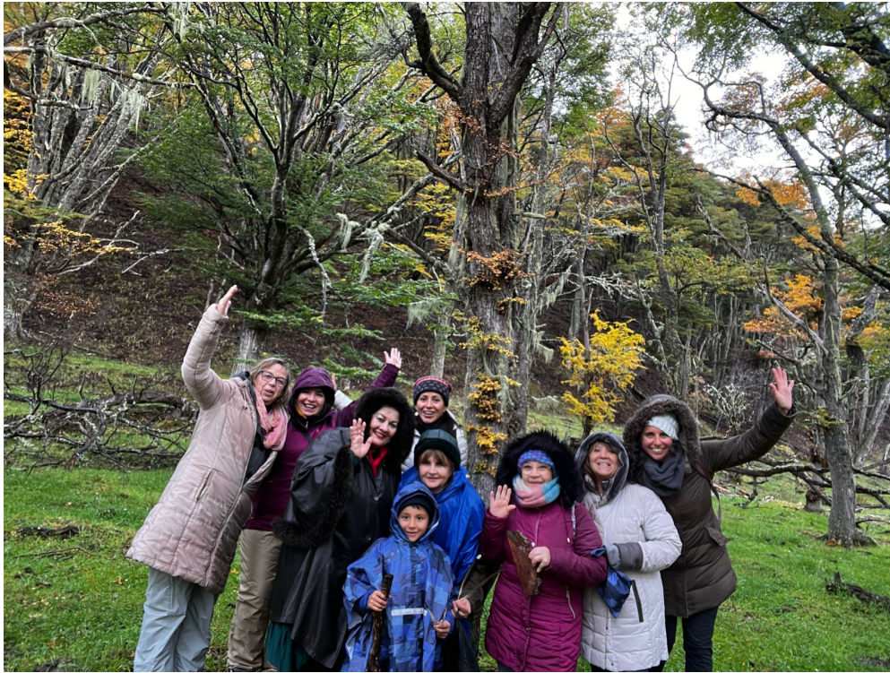
En el bosque de los árboles de la especie Nothofagus existente también en Australia y N. Zelanda