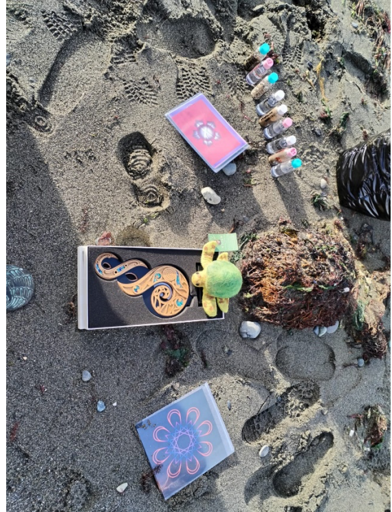
Los símbolos de la Magdalena ahora en el Estrecho Magallanes; Altar en la arena de Punta Arenas