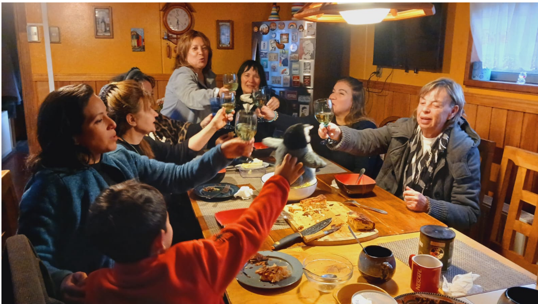
La misión Antártica cumplida