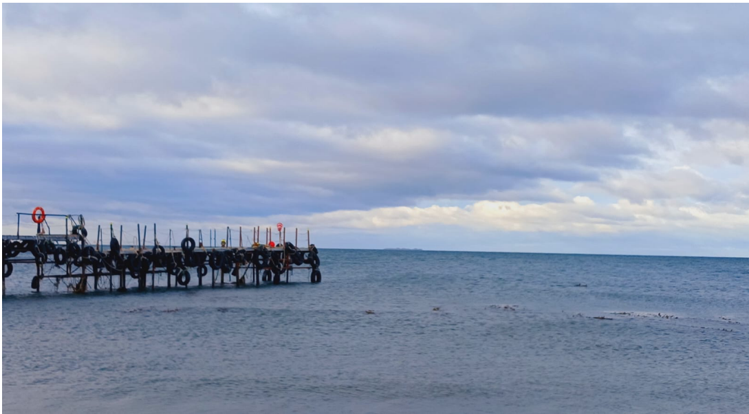
Al frente de la Isla Magdalena