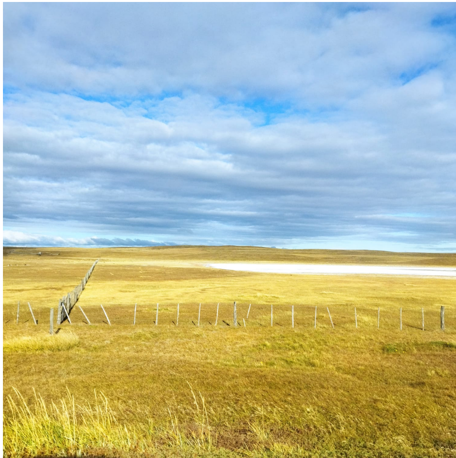
Estepas Patagónicas doradas

informa que en la Antártica se encontraba la primera civilización que se separó de lo divino, llevando no solo los códigos de la primera separación, sino el lazo más cercano con la Fuente. Y justo el derretimiento del hielo permite que esos códigos se expandan por todo el planeta a través de las aguas universales, por el Océano Antártico y el Océano Pacífico, que se unen en el Estrecho de Magallanes, donde se encuentra la ciudad de Punta Arenas. Punta-significa punto, Arenas-significa arena llena de cuarzo. Yo recibí una interpretación más: punto (punta) hacia (a) renacimiento (renas/renacimiento).