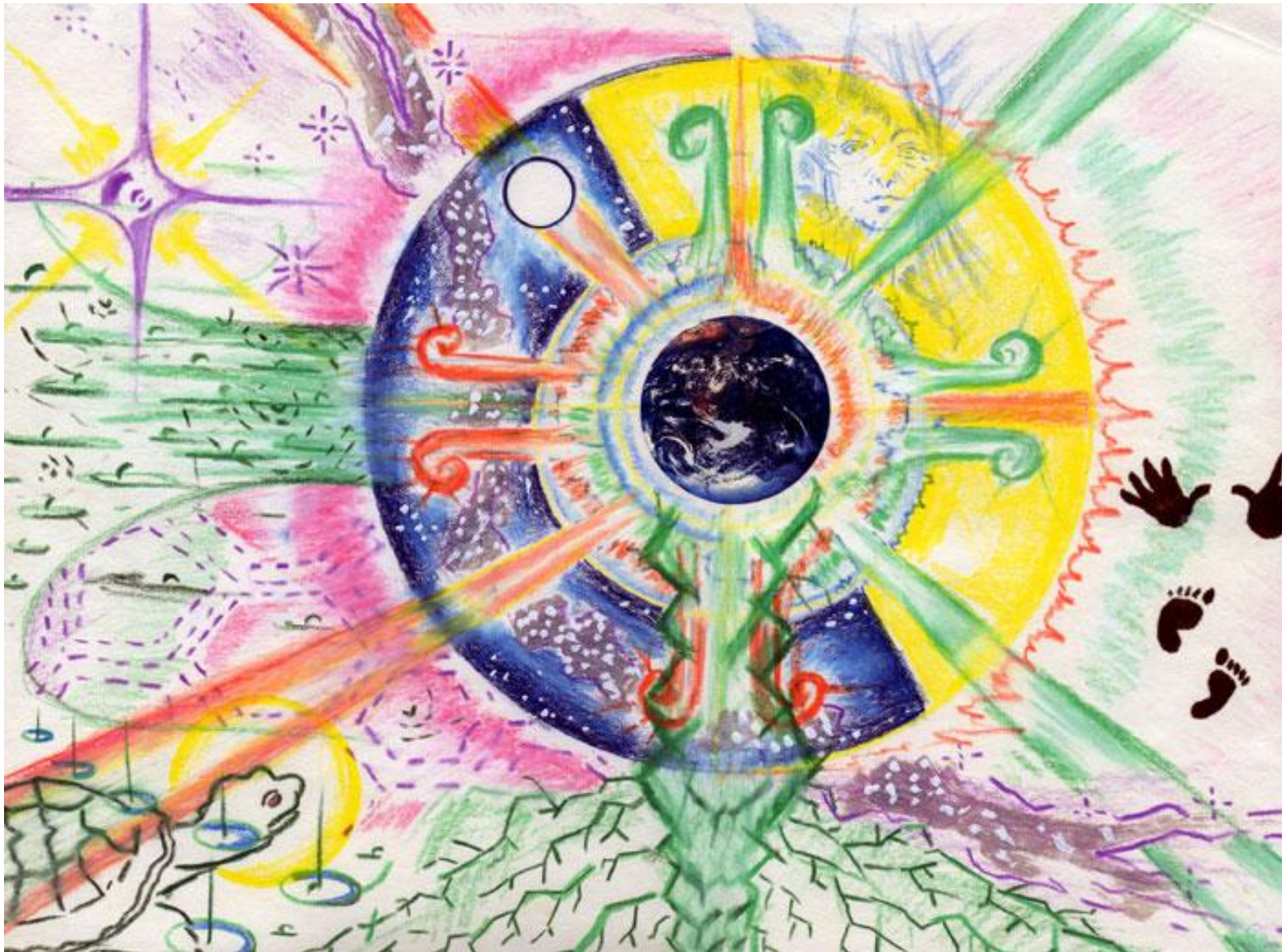
● ● Bisabuela Galaxia habla sobre el tiempo