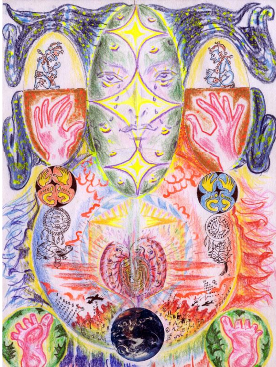
(22) STAR MOTHER MAYA TESTIFIES AT THE COUNCIL OF THE CHILDREN OF THE EARTH

22 La estrella - Madre Maya testifica en el consejo de los hijos de la tierra