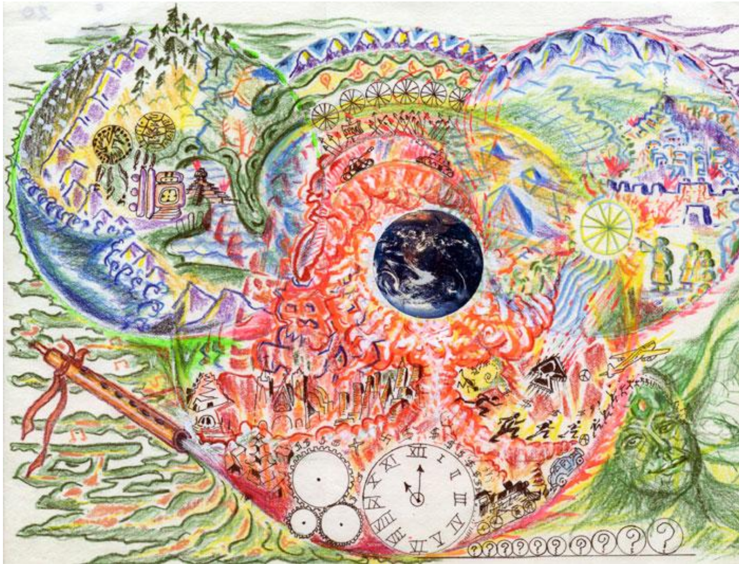
(20) THE WAY OF THE SEED: HUMAN FORGETS EARTH REMEMBERS 20 El camino de la semilla: Los humanos olvidaron. La tierra recuerda