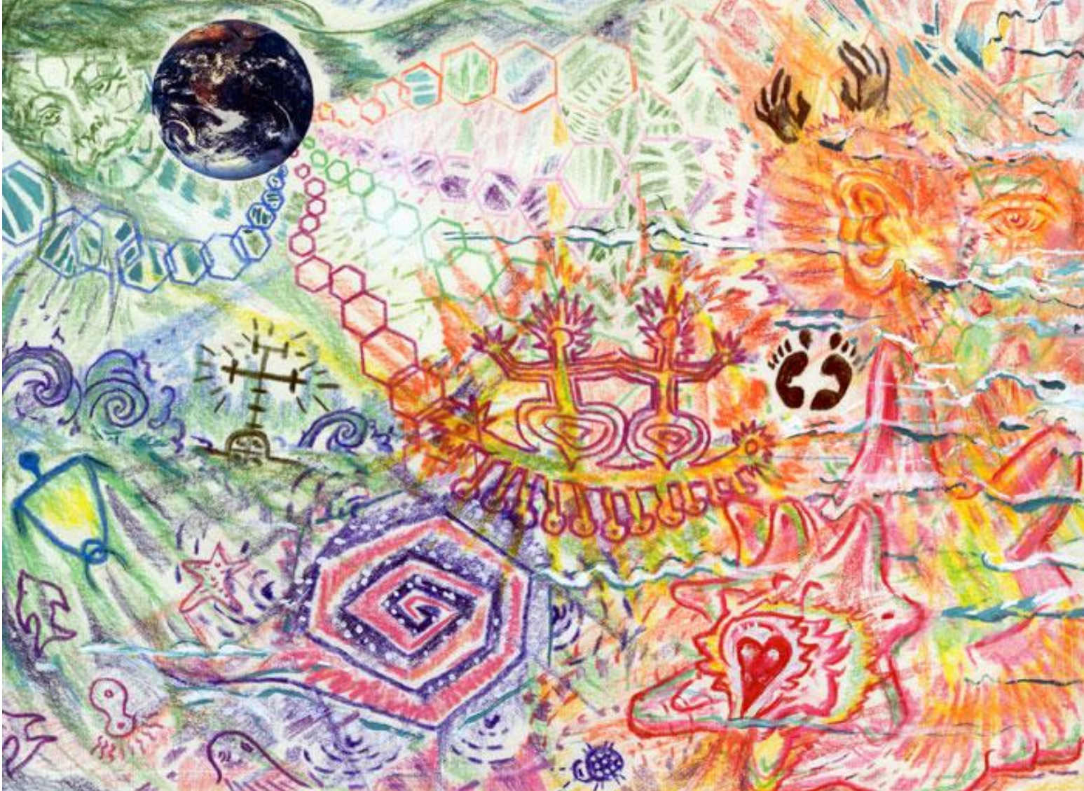
(12) GREAT GRANDMOTHER GALAXY TALKS CLOSE AND NEAR