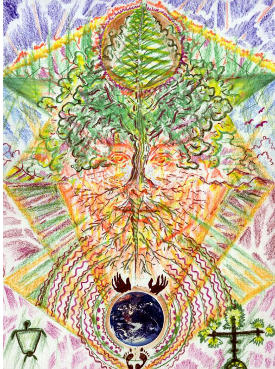
*** Por qué el árbol se mantiene erecto