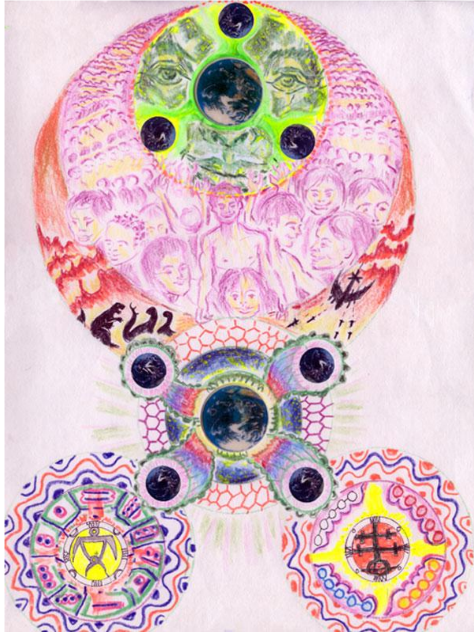
(24) SOVEREIGN DECLARATION OF BIOSPHERE RIGHTS 24 Declaración soberana de los derechos biosféricos