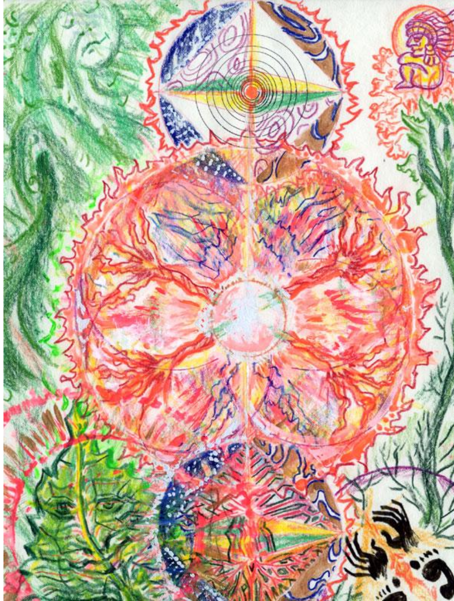
(14) TURTLE GOES TO THE MOON 14 La tortuga se va para la luna