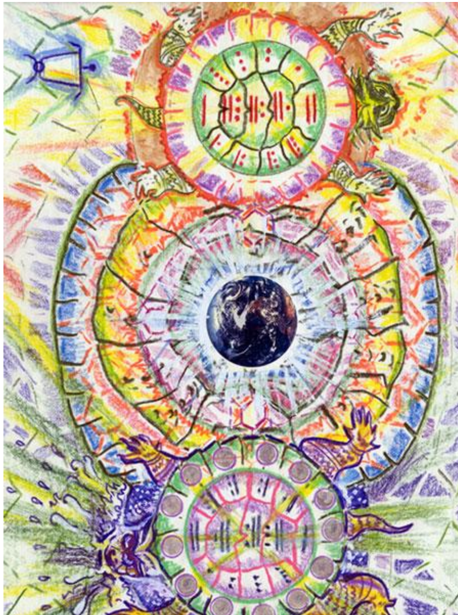
☰ Por qué la tortuga tiene un casco