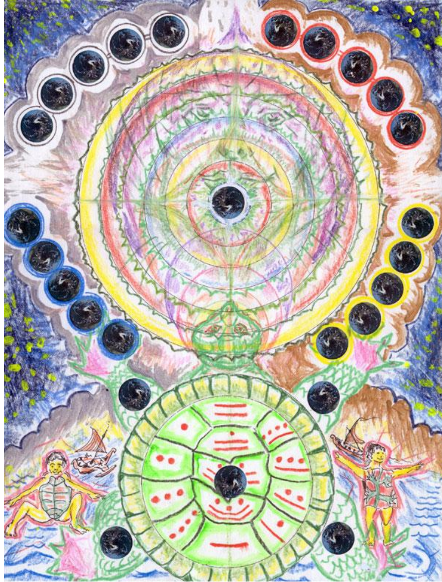
(25) MAGIC TURTLE, MAGIC TREE A GENERATION OF THE EARTH

25 Tortuga Mágica, Árbol Mágico, Una Generación de la Tierra