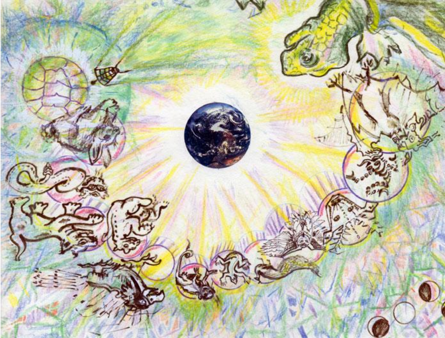
(13) TURTLE AND TREE AT THE END OF THE TIME OF THE BECOMING

13 La tortuga y el árbol en el final del tiempo del génesis