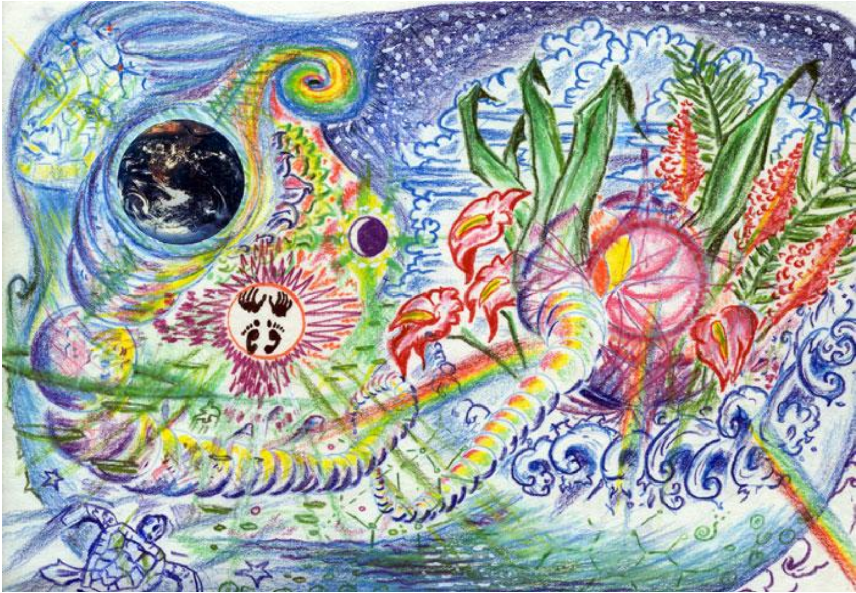
— - La biosfera, la esfera terrestre alrededor del tiempo