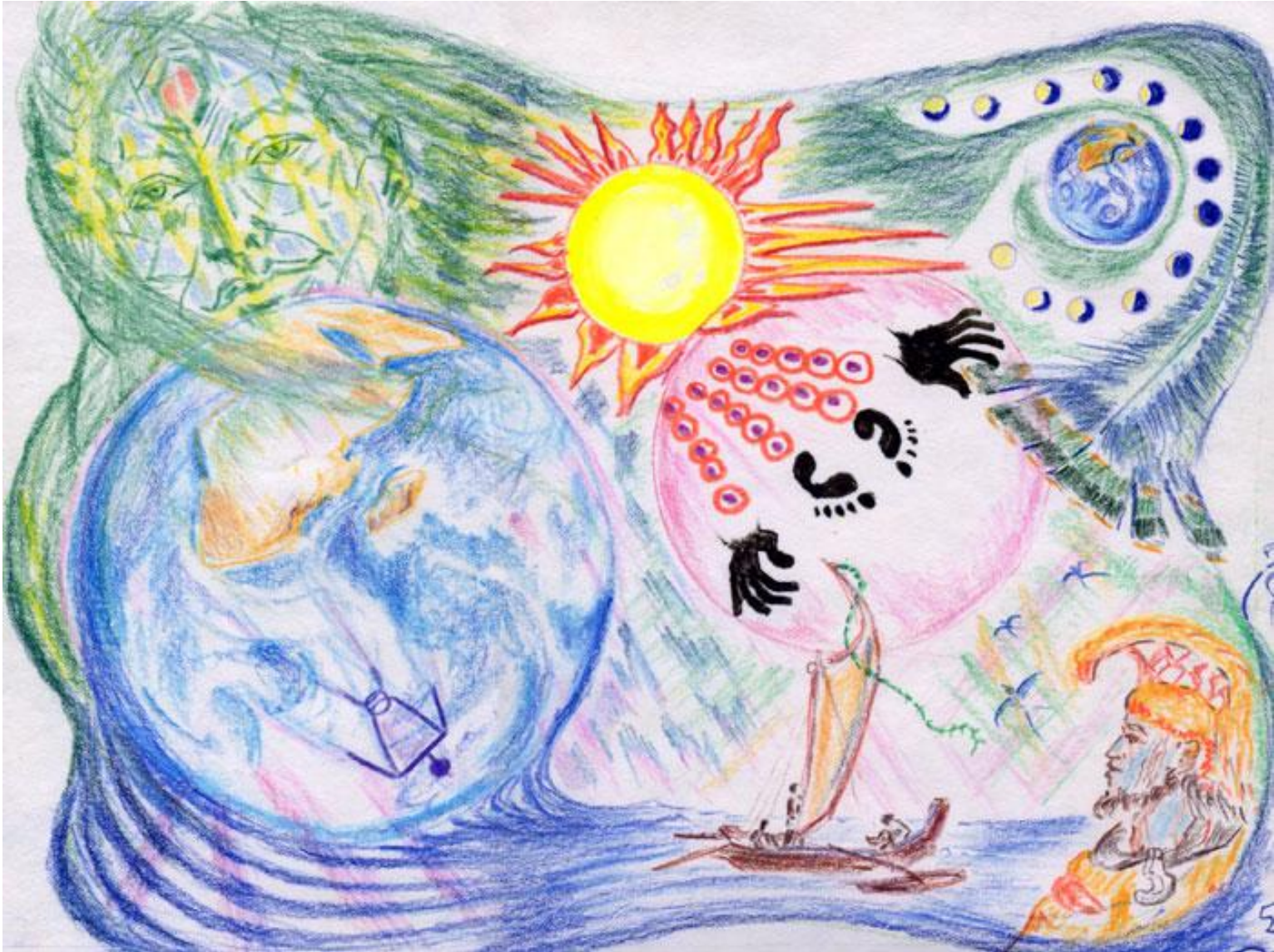
(16) EARTH MOTHER TALKS 16 La madre tierra habla