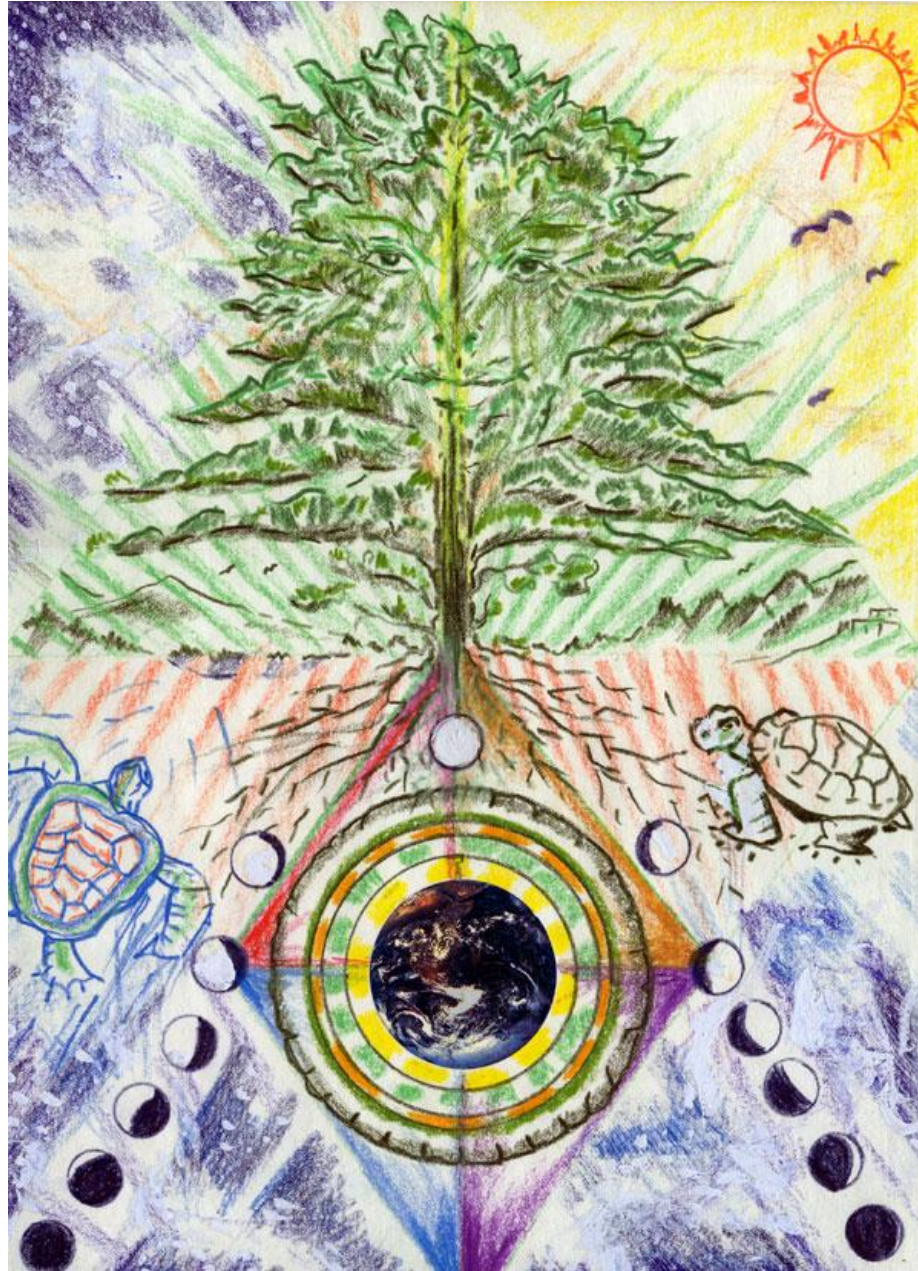
El árbol habla del tiempo