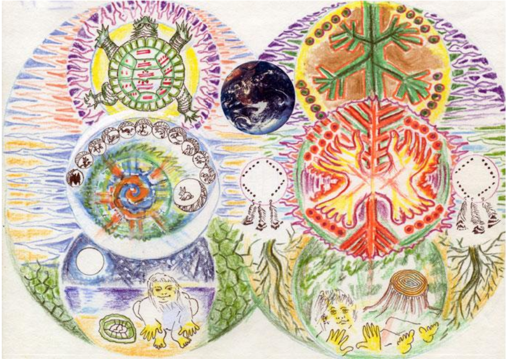
(17) DREAMS OF THE CHILDREN OF TIME 17 Sueños de las Criaturas del Tiempo