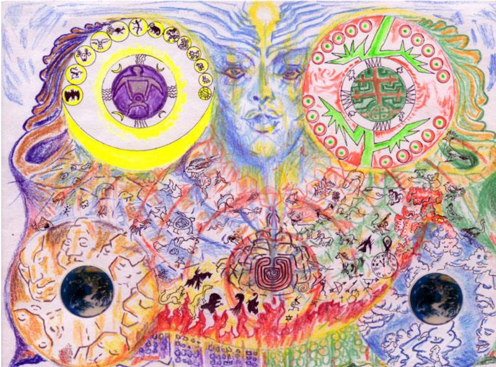
21 Tortuga y árbol convocan El consejo de los hijos de la tierra