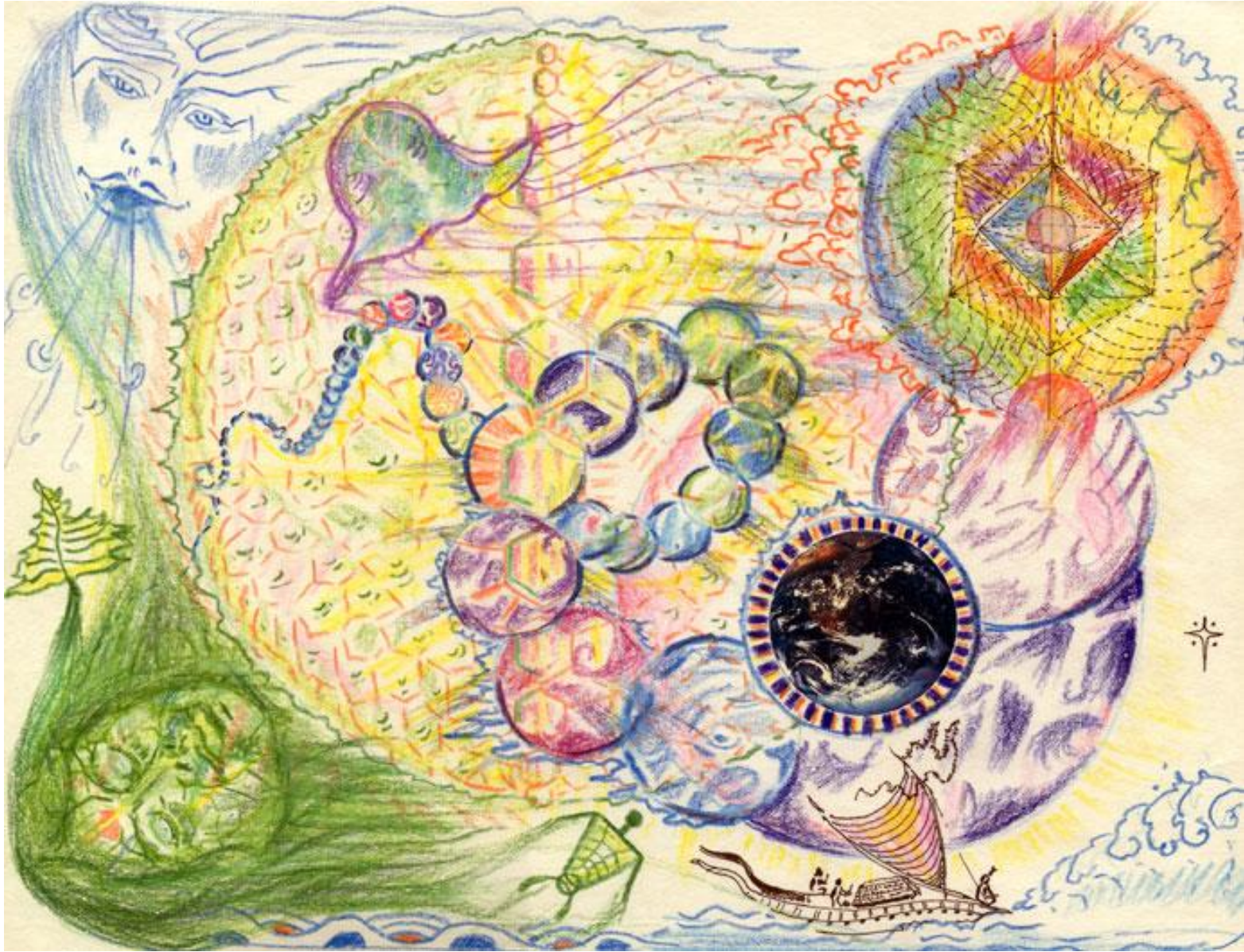
(18) SPIRIT TALKS, BIOSPHERE RECYCLES 18 El espíritu, la biosfera se recicla