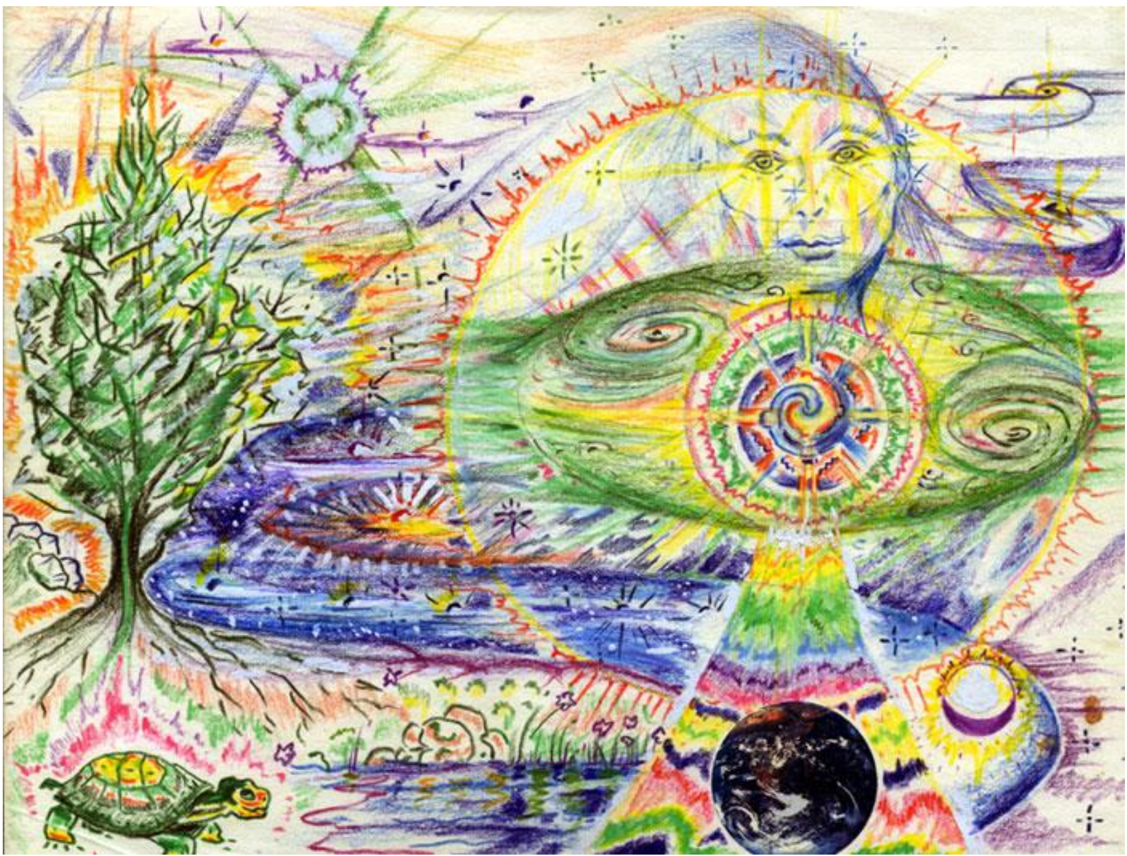
● La Bisabuela Galaxia se presenta