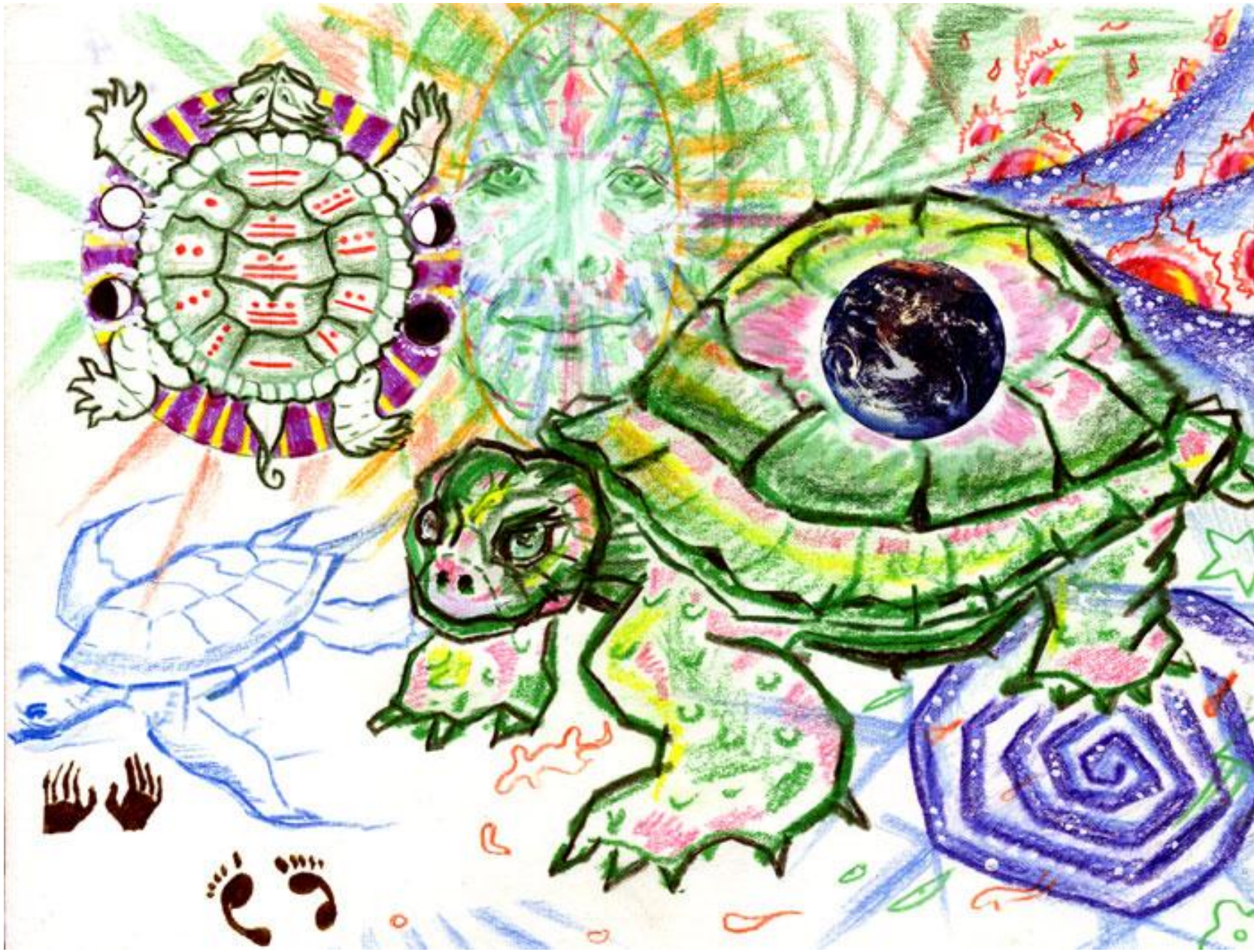
●●●● La tortuga habla del tiempo