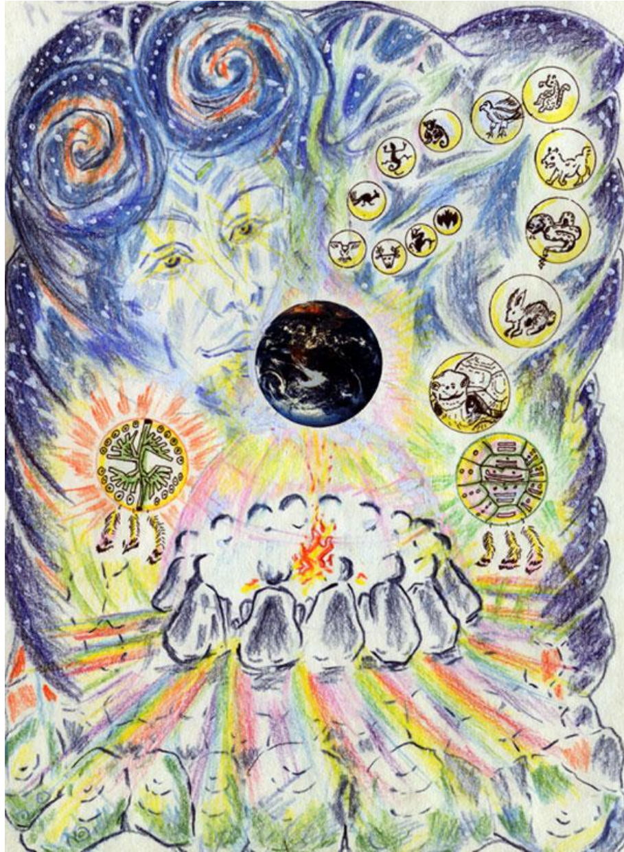
(19) COUNCIL OF THE PEOPLES OF THE TURTLE AND THE TREE 19 Consejo de los pueblos de la tortuga y el árbol