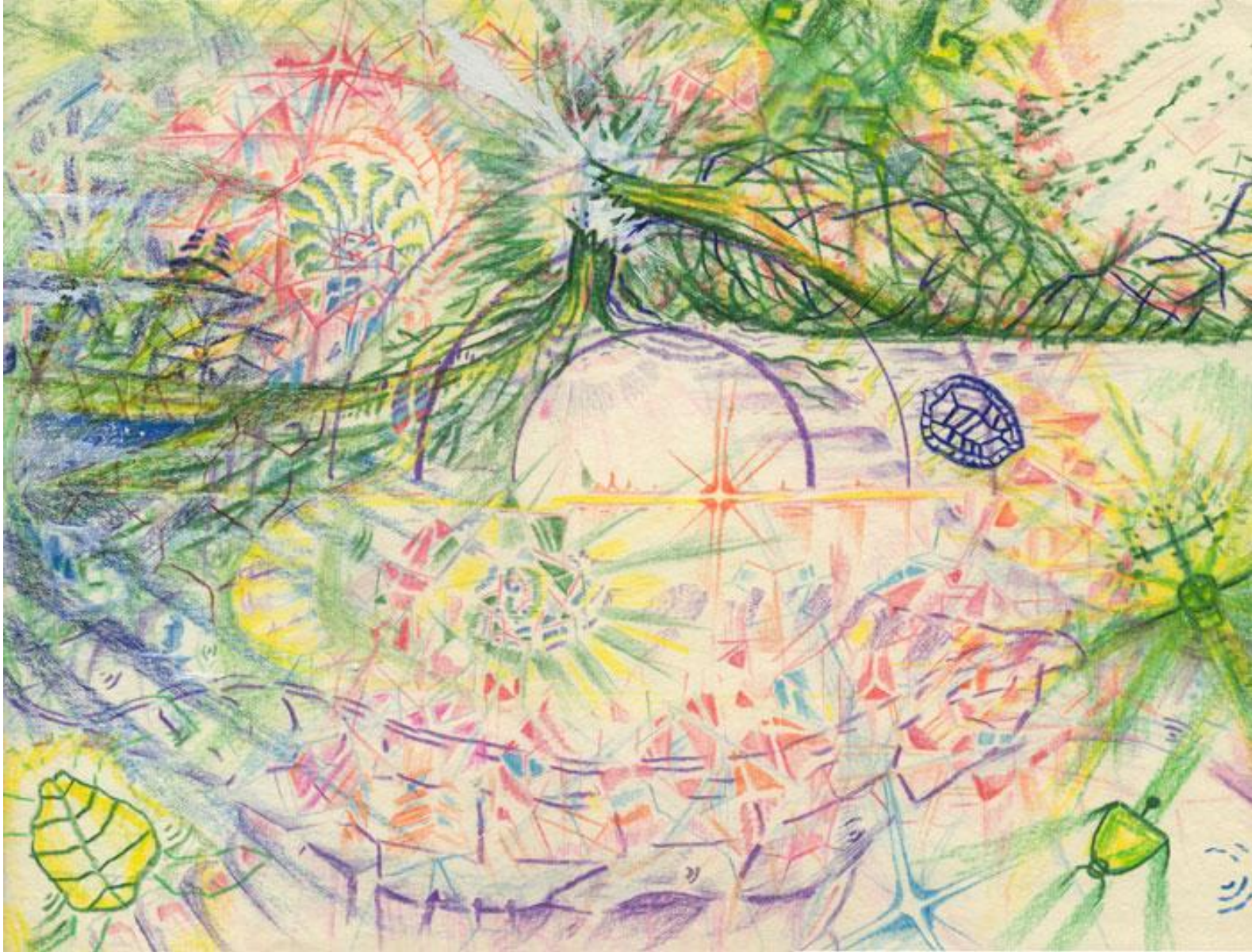
11 Tortuga y árbol retornan al tiempo del sueño