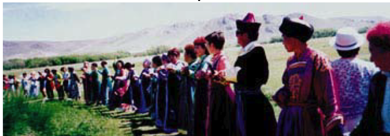
Day-Out-of-Time 2000. Altai, the former Soviet Union.