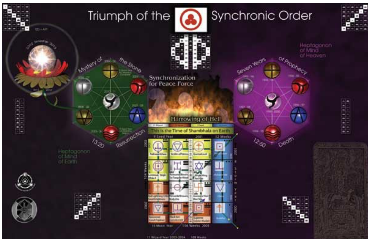
Las 4 Piedras de Tiempo del Puente sobre el Horror de Infierno, NS1.13-NS1.16 2000-2004

Entre esta piedra y la séptima, situada en lo alto del portal izquierdo de la Puerta del Tiempo — la piedra del último de los Siete Videntes—, hay dos piedras del anillos, las piedras angulares, por así decirlo, de la Puerta del Tiempo: NS1.14: Semilla 9 y NS1.15: Luna 10. Aún no hay nada establecido en el tiempo bajo estas piedras; representan la voluntad pura de la Campaña por el Nuevo Tiempo de alcanzar su objetivo profético de cambio al Sincronario para el 52.º retorno solar de la apertura de la tumba de Pacal Votan. Estos cuatro anillos son críticos para establecer la arquitectura del orden sincrónico, también conocido como la Puerta del Tiempo .